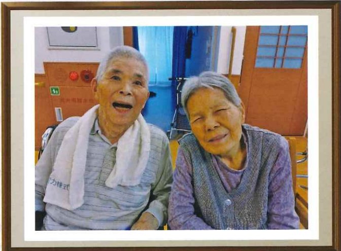
フォトコンテスト 優秀賞作品