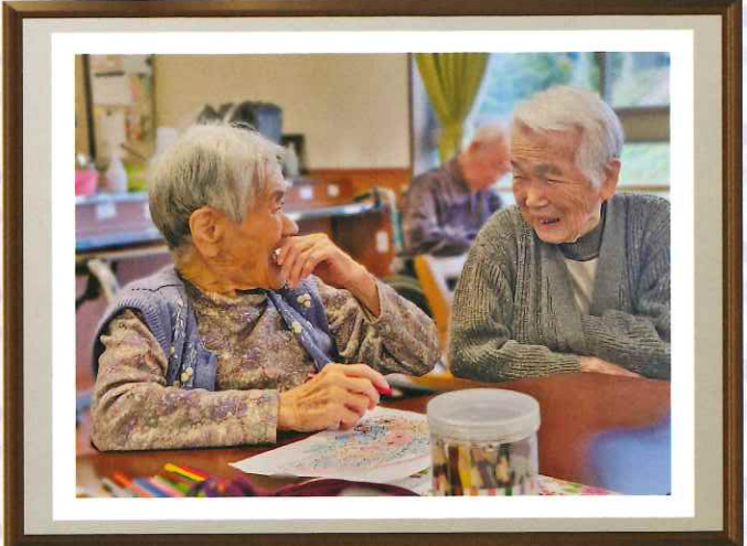
フォトコンテスト 最優秀賞作品